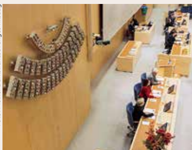
Majoriteten har svängt i riksdagen.